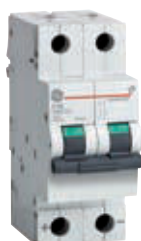
2P 2 мод.

Для применения в ж/д транспорте, для подключения кабелей с кольцевыми наконечниками